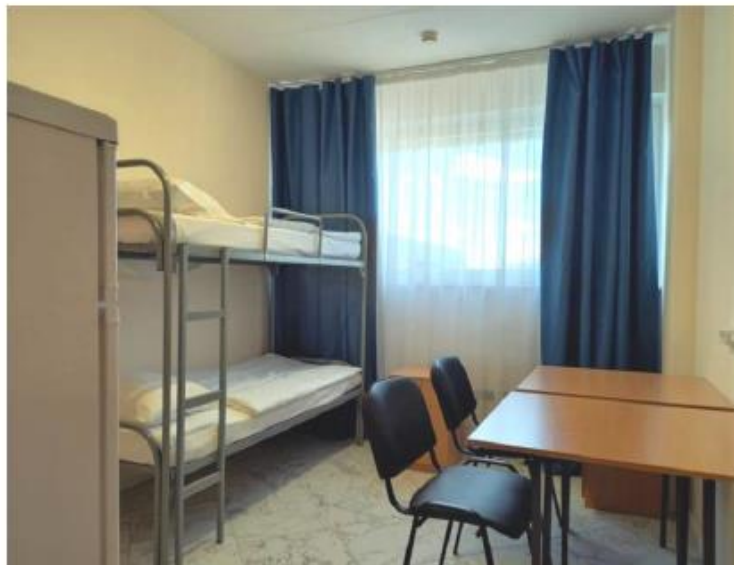
2-х местная комната