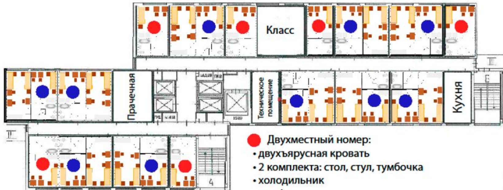
СХЕМА ТИПОВОГО ЭТАЖА